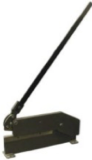
Cizalla disponible como opción