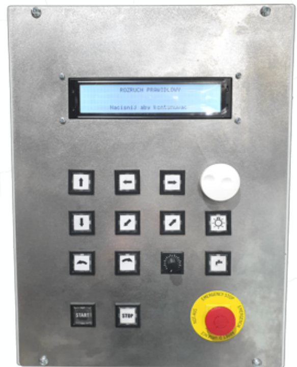
Panel de control de fácil manejo