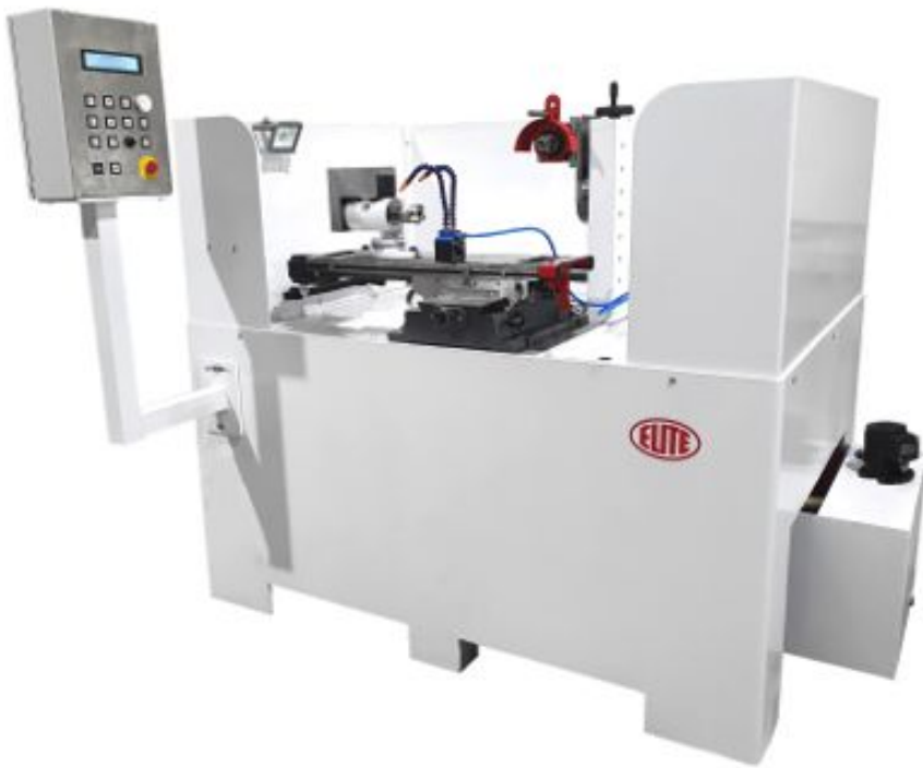
Media cabina con el panel de control. Disponible de forma opcional