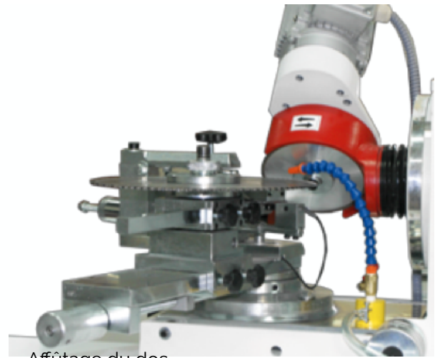
Affûtage du dos