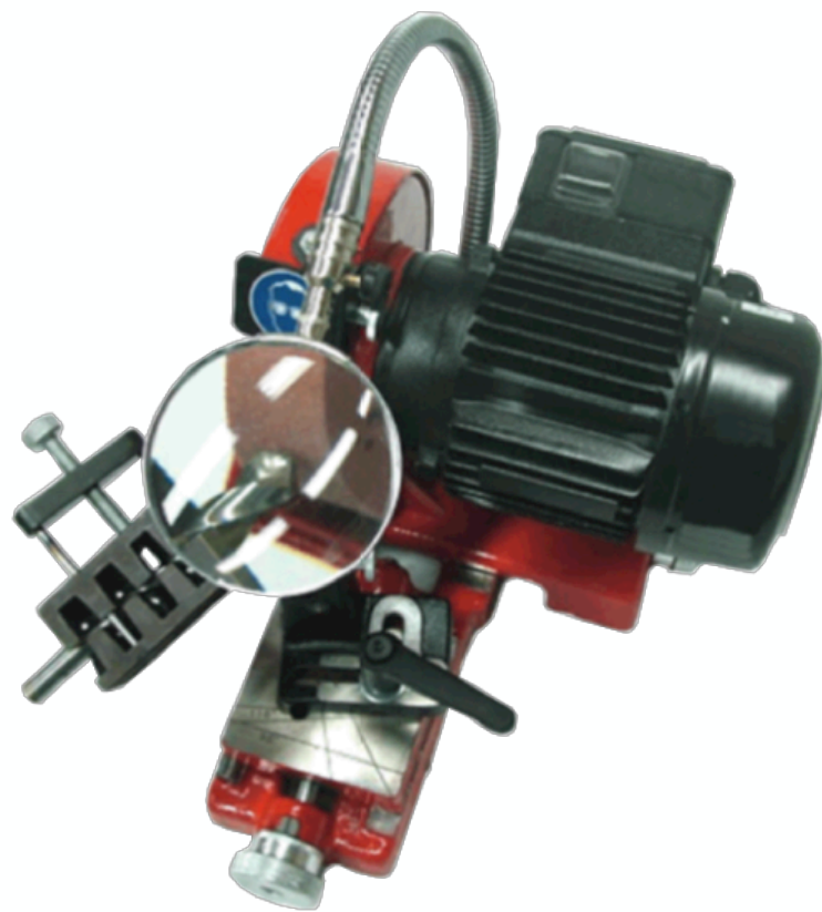
Lente d'ingrandimento per un lavoro di qualità