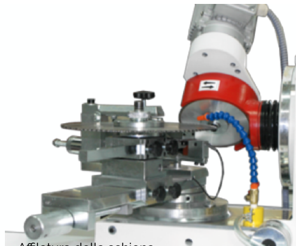
Affilatura della schiena