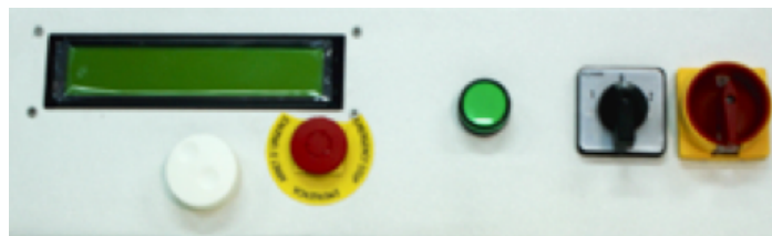
Display LCD per una facile programmazione del ciclo di affilatura