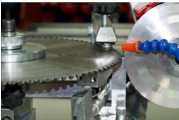
Raffreddamento della lama della sega circolare.

La macchina può essere opzionalmente dotata di un sistema di raffreddamento comprensivo di vassoio, serbatoio del refrigerante e pompa.