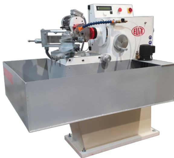
Vaschetta di raccolta del refrigerante

La macchina può essere opzionalmente dotata di un sistema di raffreddamento comprensivo di vassoio, serbatoio del refrigerante e pompa.