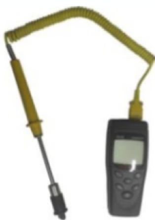
Termometro digitale disponibile come opzione