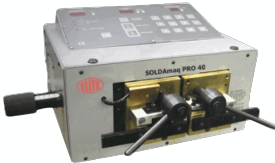
Versione con pannello di controllo digitale