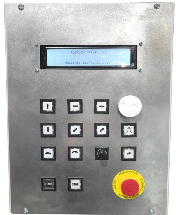
Painel de controle amigável