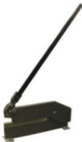
Tesoura disponível como opção