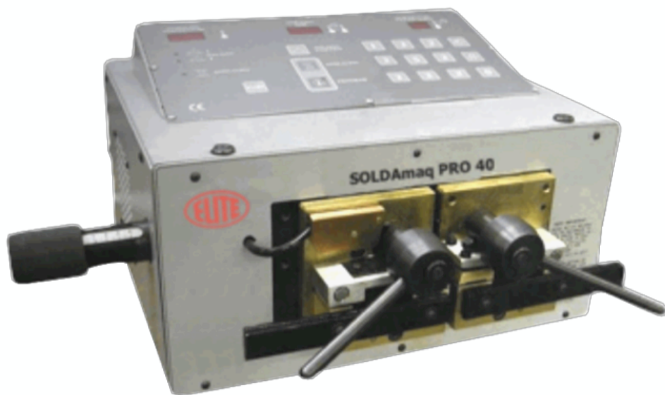
Versão com painel de controle digital